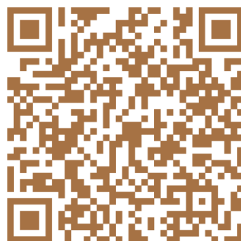
Двенадцатое задание (Школа)