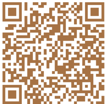
Легенда и правила квеста